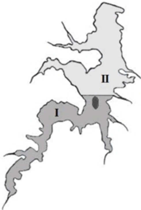
Função das Unidades do Sistema de Reservatório de Guarapiranga