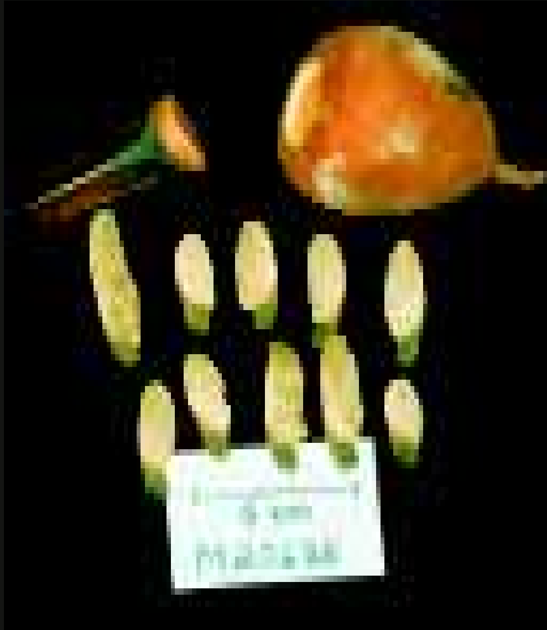
Frutos e sementes do tauari ( Cariniana micrantha ), árvore com sementes aladas dispersas pelo vento.