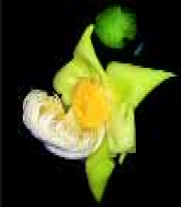
Flor de jarana amarela ( Lecythis poiteaui ) com simetria bilateral polinizada por morcegos.