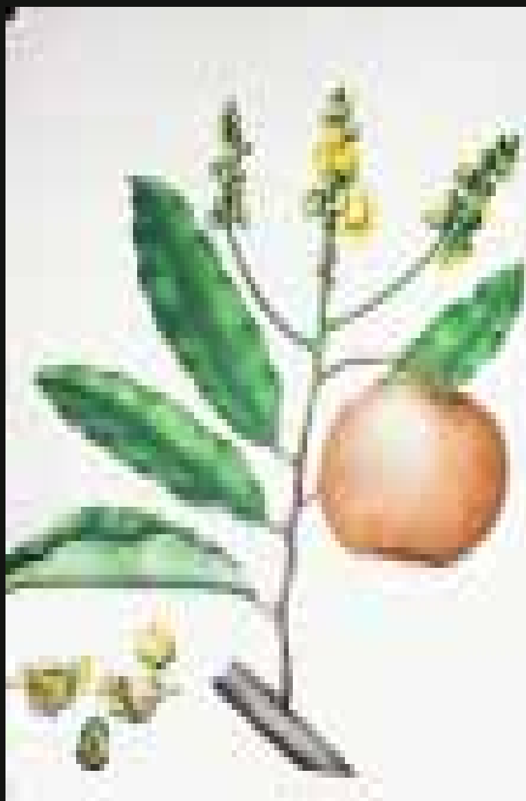
Ilustração de ramos, flor e fruto de uma castanha-do-pará ( Bertholletia excelsa ) feita durante a Viagem Filosófica de Alexandre Rodrigues Ferreira pela Amazônia, entre os anos 1784 e 1793.