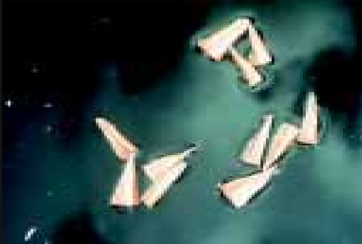
Sementes de macacarecuia ( Eschweilera tenuifolia ) flutuando nas águas do Rio Negro graças à camada externa de cortiça.