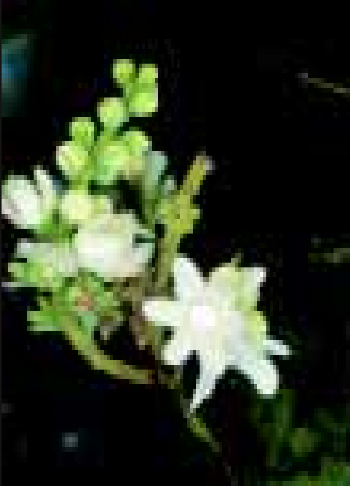
Flores de simetria bilateral de tauari ( Cariniana micrantha ).