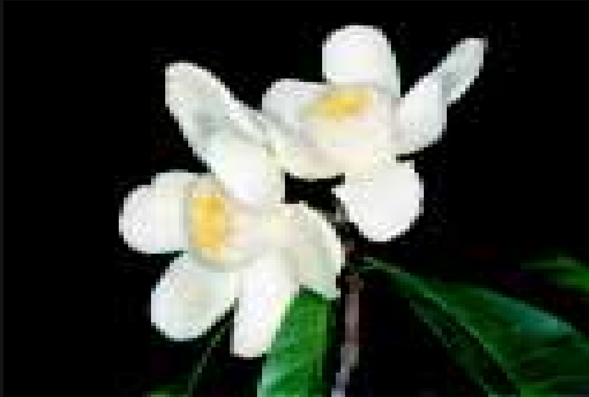
Flores de jeniparana ( Gustavia hexapetala ), uma espécie com flores de simetria radial.