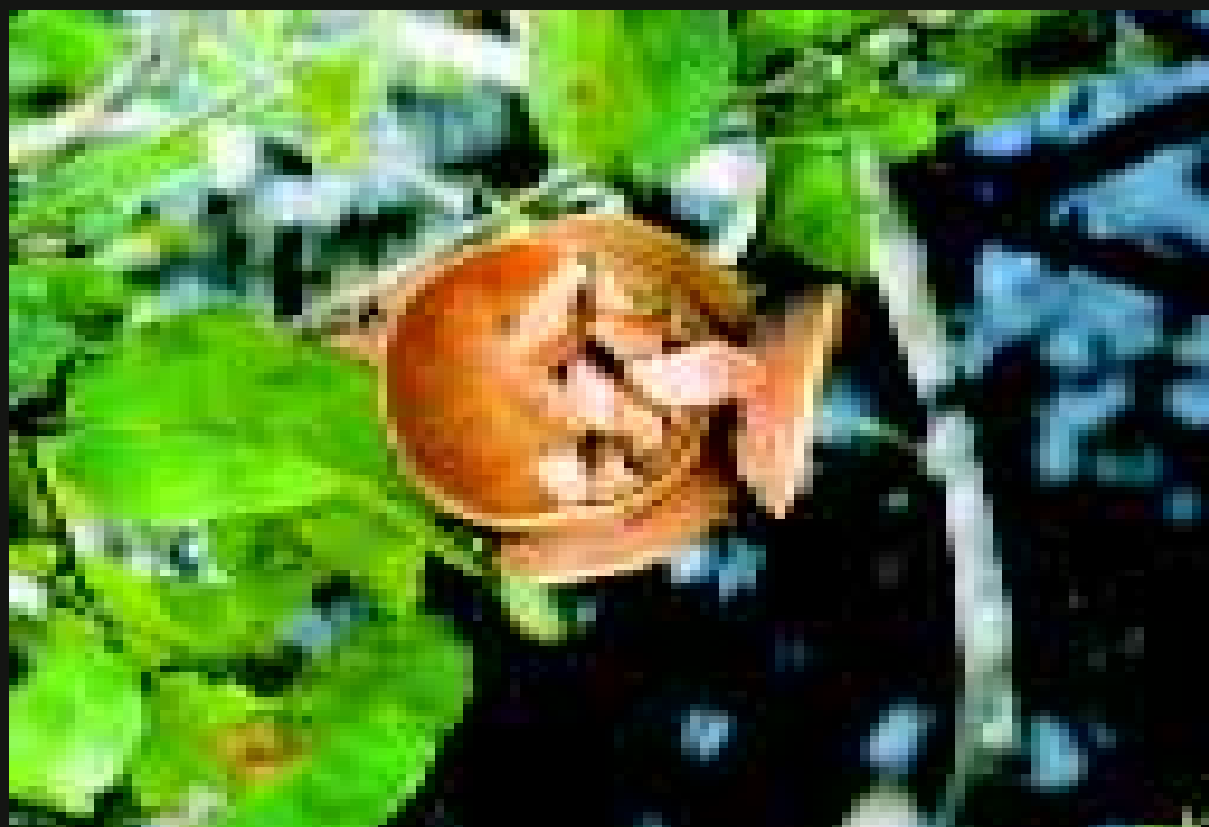
Frutos e sementes da macacarecuia ( Eschweilera tenuifolia ) dispersas pela água.