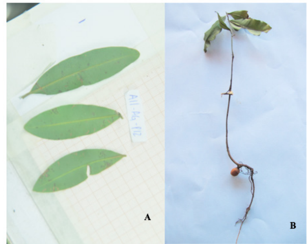
Figura 2. A - Folhas de Calophyllum brasiliensis Cambess. sobre papel milimetrado para a medição da área no programa ImageJ®. B - Plântula de C. brasiliensis Cambess.